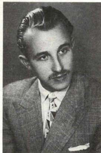
Тома у Крагујевцу 1954