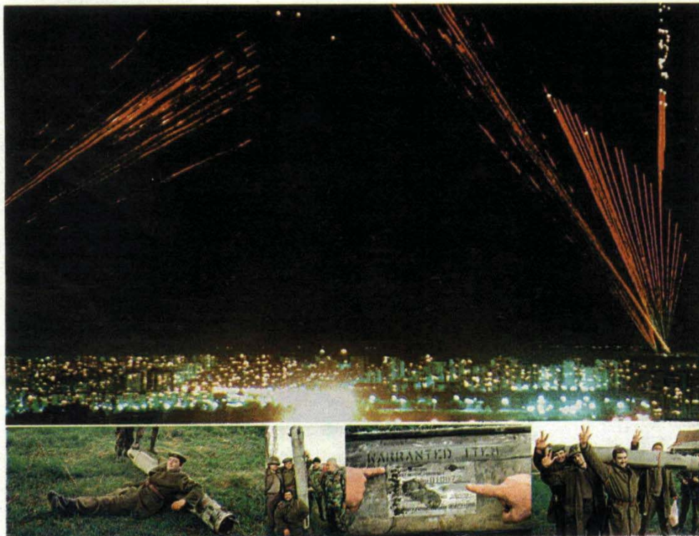
Један од панона изложби која ће бити отворена 3. марта

Једна од две ракете која је код Бешке оштетила мост на Дунаву