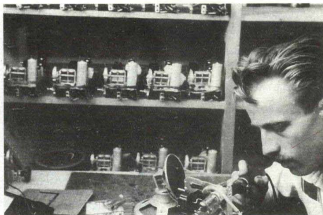
На занату у крагујевачком електро-сервису 1952.

Питамо нашег саговорника када је снимио први кадар са бомбама које су засипале наш главни град у пролеће 1999. Био је на тераси стана у Новом Београду када су се 24. марта у 19 и 45 часова огласиле сирене за узбуну због ваздушних напада и