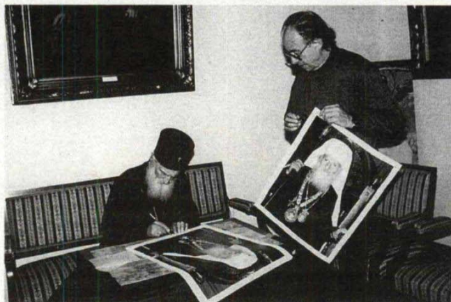
Снимио је патријарха Павла за први постер и донео га на потпис