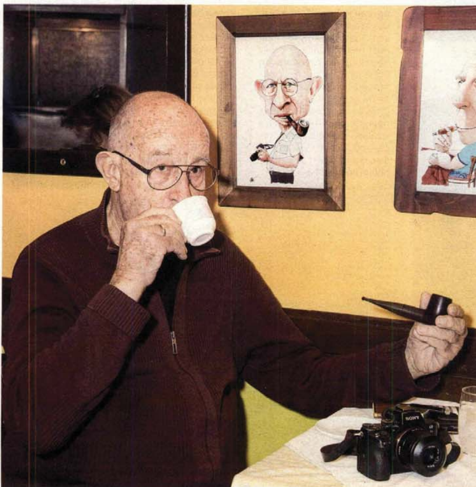
Свакогдругог дана да пријатељима се састаје у омиљеној кафани

Његове „Паклене ноћи Београда“ и овог марта ће нас подсетити на 1999. Тим поводом помињемо понешто из његовог живота, јер само за списак изложби потрошили бисмо неколико страница