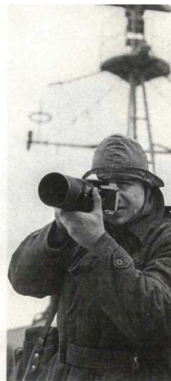
Свуда са фотоапаратом

– Имао сам идеју да на изложби не буде много фотографија, 24 панона метар са метар је савим довољно, али они ће бити допуњени у доњем делу као у фусноти са пет-шест мањих, такзваних фризова. Рецимо уз ноћну слику ракете која је изгубила оријентацију иду кадрови шта је с њом било када је пала на тло. Зна се да су новинари и сниматељи током бомбардовања радили у прес-центру смештеном у Дому војске, увек смо имали информације где се шта догодило па сам по потреби ишао на терен. Тако сам, рецимо након годину дана, двехи-